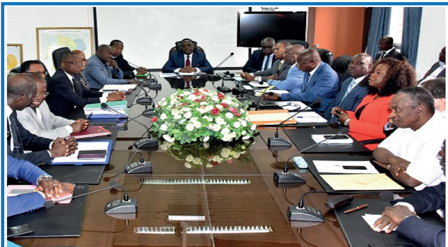
Photo des participants à la réunion