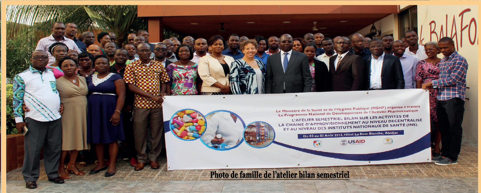
Photo de famille de l'atelier bilan semestriel