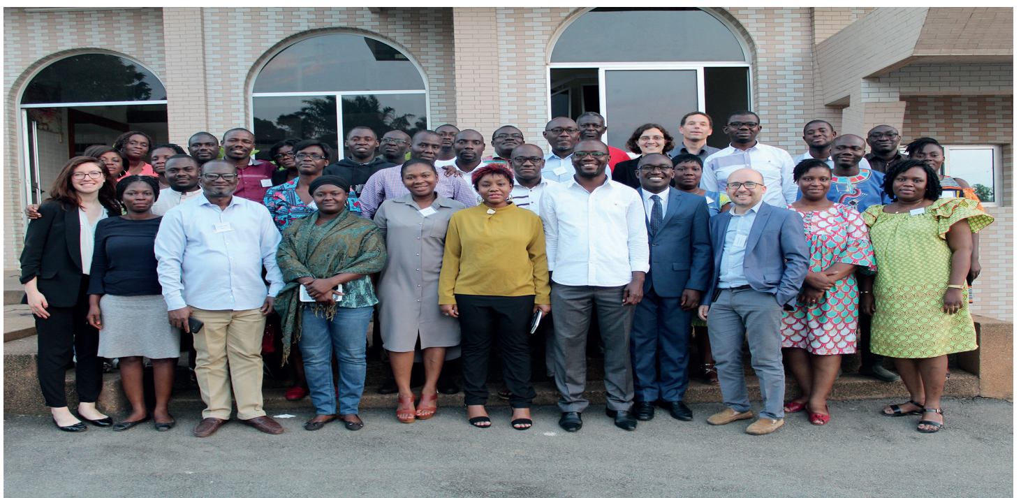
Photo de famille des participants à l'atelier