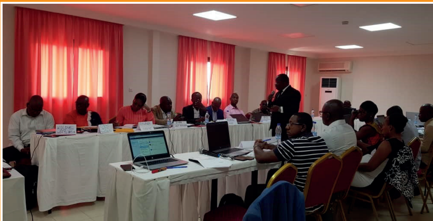
Vue des participants à l'atelier de formation