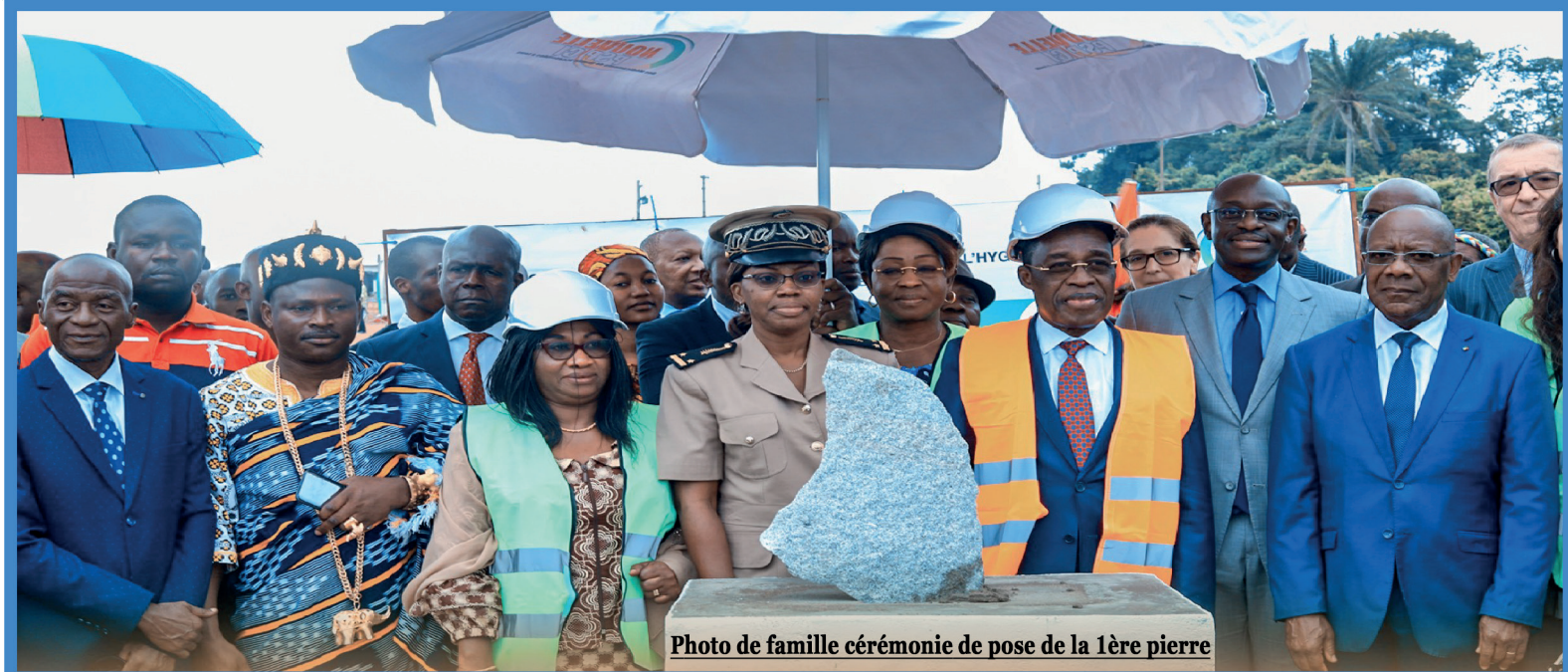
Photo de famille cérémonie de pose de la 1 ère pierre