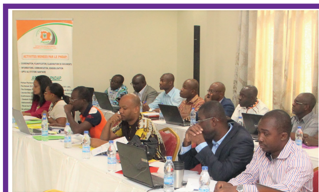
Vue des participants à l'atelier