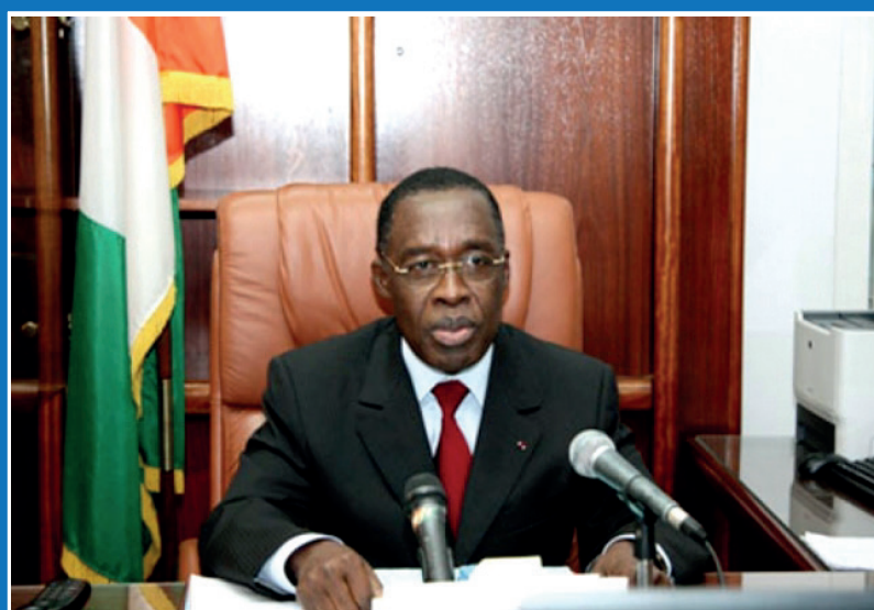
Dr AKA AOUELE Ministre de la Santé et de l'Hygiène Publique