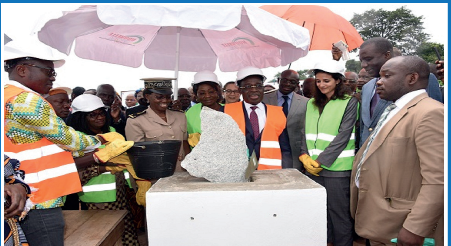
Photo de la pose de la 1 ère pierre de l'agence NPSB Bouaké