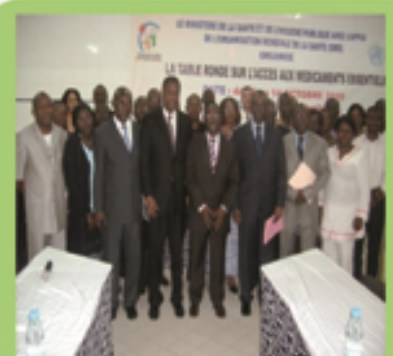
Table ronde sur l'accès aux médicaments essentiels en Côte d'Ivoire

Du 11 au 14 Octobre 2010, s'est tenue à Abidjan, une table ronde sur l'accès aux médicaments essentiels, organisée par le Ministère de la Santé et de l'Hygiène Publique (MSHP) avec l'appui de l'Organisation Mondiale de la Santé (OMS).